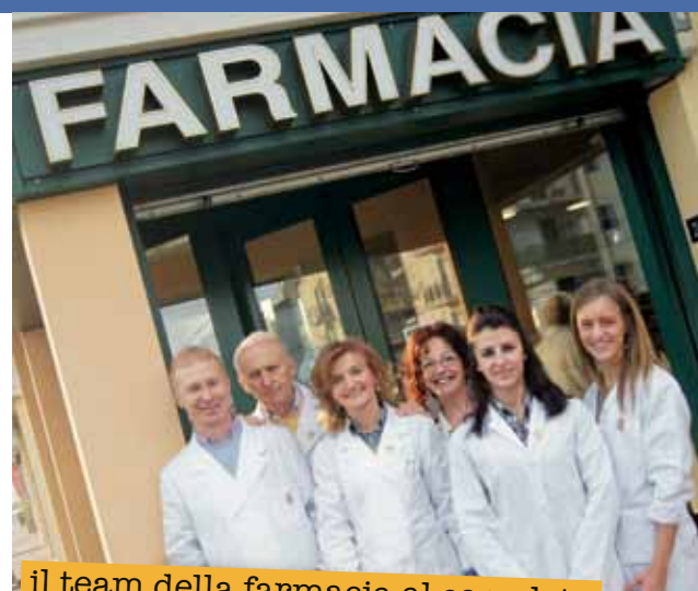
il team della farmacia al completo

volte al mese, ordinare i prodotti via email ( farmaciadeantoni@gmail.com ), fax (0444 378021) o telefono. Tramite la newsletter si può essere avvisati sulle ultime novità della farmacia: l'arrivo di nuovi prodotti e l'organizzazione di particolari giornate per la loro presentazione con distribuzione di campioni gratuiti. In farmacia è possibile effettuare vari test auto-diagnostici (colesterolo, trigliceridi, transaminasi, etc...) tra cui Xeliac Test per ricercare una eventuale celiachia, ovviamente da approfondire con il proprio medico curante.